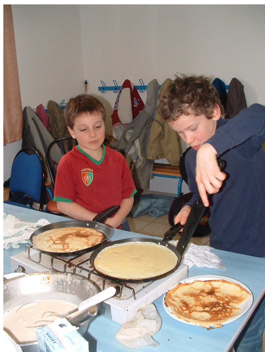
Crêpes avec « La Darnetzienne »

rencontres ou sorties inter associations.